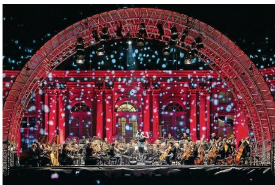
Spektakuläre Kulisse am Monrepos.